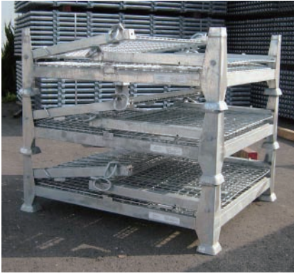
■折り畳み時の段積み