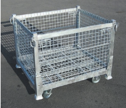
■キャスター（オプション）を付けた状態