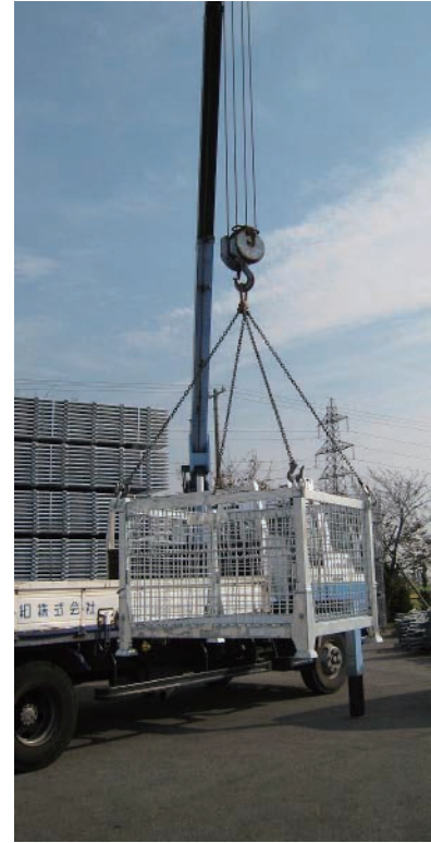
■ユニックでの作業（イメージ）