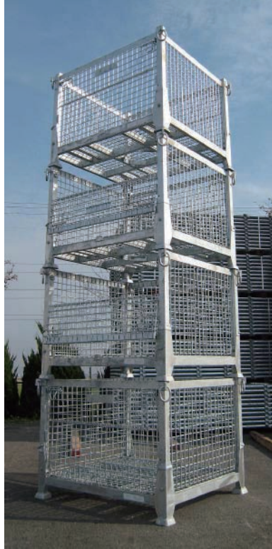
■段積み使用時（イメージ）