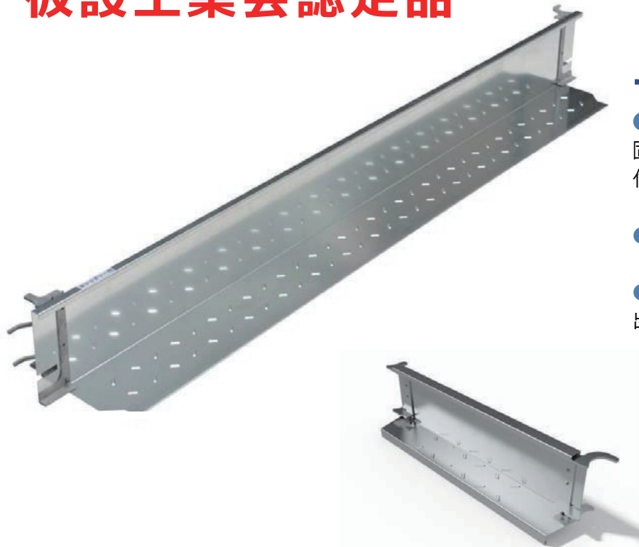
妻側(コーナー)用幅木