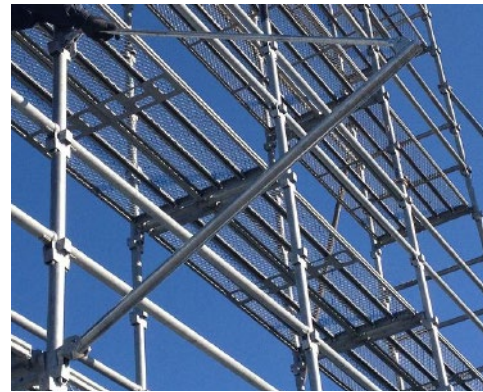
② 下部クサビ取付位置から3コマ上に上部クサビを差し込む