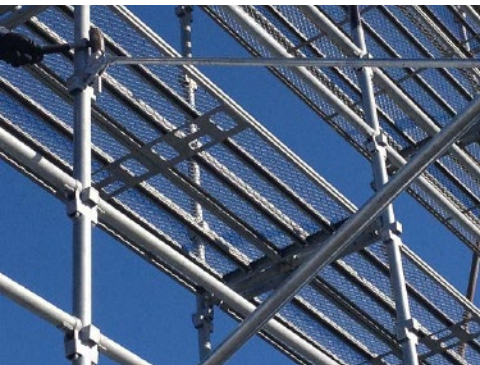
③ 上下両方のクサビをハンマーを用いて固定する