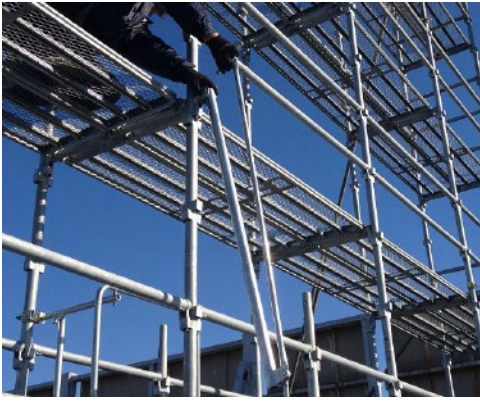
① 下部クサビを取付位置の支柱クサビ受けに差し込む