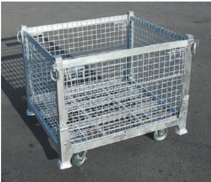
■ キャスター（オプション）を付けた状態