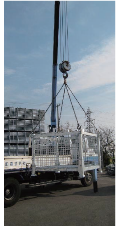
■ ユニックでの作業（イメージ）