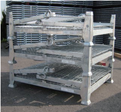
■ 折り畳み時の段積み